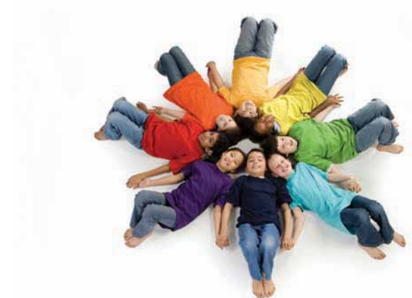
Todos los programas de salud mental están acreditados por CARF

Wellness Initiative Network (WIN) and West Cook Housing Initiative Partnership (WCHIP) responden a las necesidades médicas y de salud mental de personas sin hogar, ayudándoles a obtener y permanecer en viviendas.